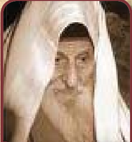
רבי כ"ק יצחק כדורי זצ"ל נ"ע ר"י המקובלים נחלת יצחק מפניחילי תורת הקבלה