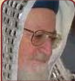
הרב מרדכי אליהו שליט"א הראשון לציון הרה"ג הראשי לישראל (לשעבר)