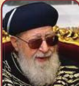
הרב עובדיה יוסף שליט"א גדול הדור הראשון לציון נשיא מועצת החכמים