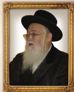
הגה"צ רבי שלום יהודה גראס האדמו"ר מהאלמין שליט"א