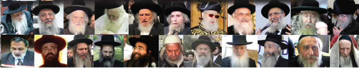
רבי שלום יהודה גרוס האדמו"ר מהאלמין נשיא מפעל הזוהר העולמי

לספק ירקות לכל ארץ ישראל, במחיר זול, וצילמתי הדברים, ולדאבוננו בעוה"ר עדיין לא שמענו שועדי הכשרות יפעלו בזה.