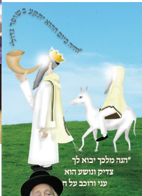
"הנה מלך יבוא לך צדיק ונושע הוא עני ורוכב על ח