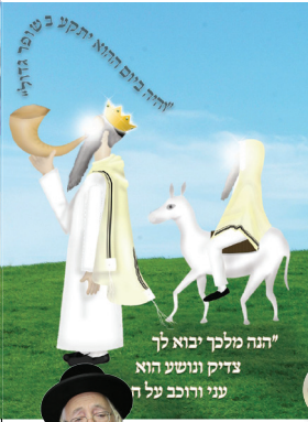
"הנה מלך יבוא לך צדיק ונושע הוא עני ורוכב על ח"י"