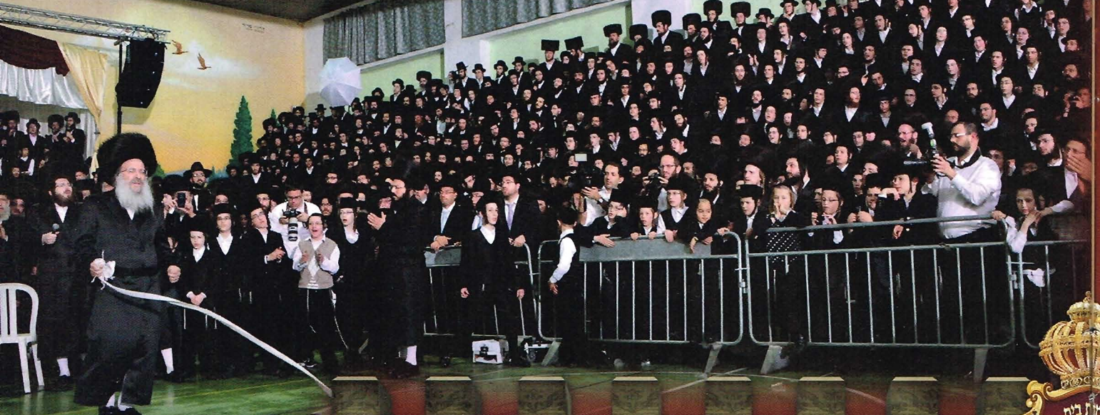
האדמו"ר פנה לברכה כפצתה פאנגן