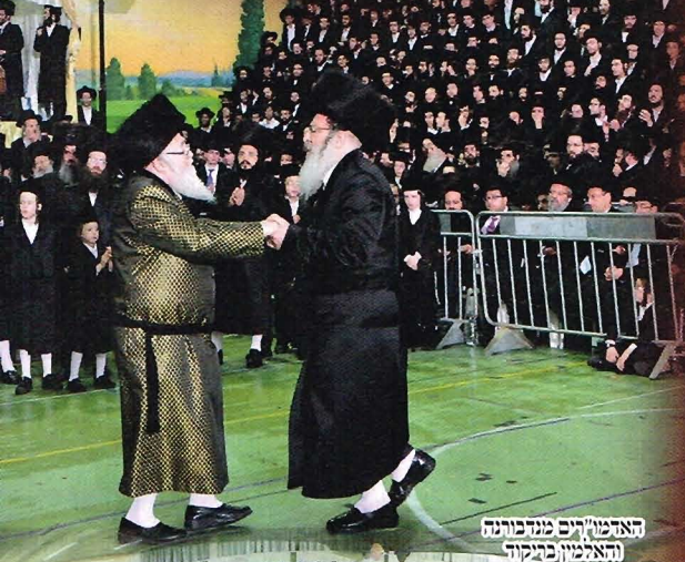
האדמו"רים פנה לברכה האדמו"ר פנה לברכה