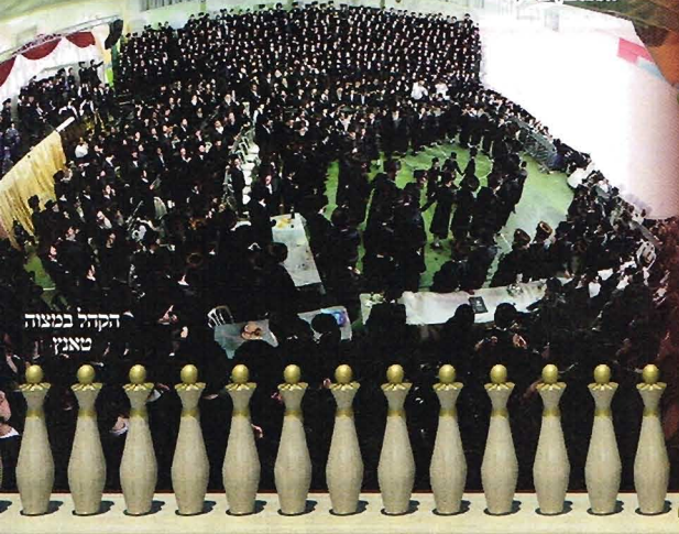
הקודם בנימוח טאנגן