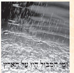
ומי הפביל היו על הארץ

רבי יוסי היה מצוי לפני רבי שמעון יום אחד אמר לו, מה ראה הקדוש ברוך הוא להשמיד את כל חיות הבר ועוף השמים עם הרשעים? אם בני האדם חטאו, בהמות ועופות השמים ושאר הבריות מה חטאו? אמר לו, הבריות "כי השחית כל בשר את דרכו על הארץ". כלם היו משחיתים דרכיהם. עזבו את מינם ונדבקו במין אחר.