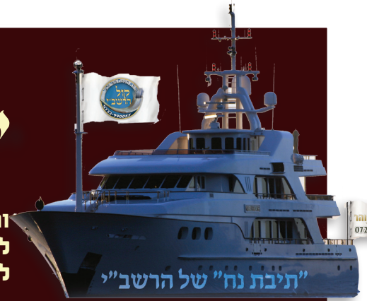
"תיבת נח" של הרשב"י

והוא קול קורא לכל יהודי ויהודי באשר הוא, להכנס לתוך התיבת נח של הזוהר הקדוש, להינצל מדור המבול הנורא השוטף את הארץ