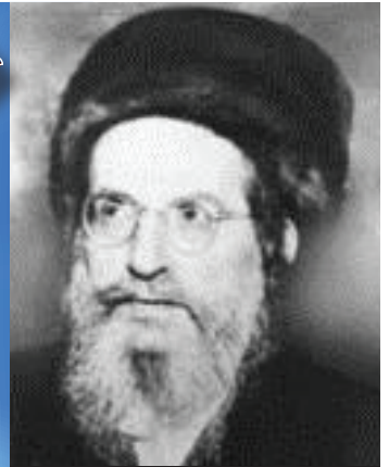
רבינו בעל הסולם נשמת האריז"ל בדורינו