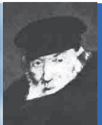
מרן רבינו החפץ חיים זיע"א