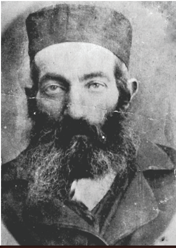
תמונת הגאון הצדיק מחבר ספר קול הקורא זצ"ל