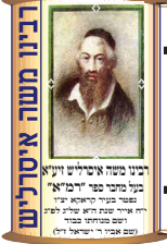
רבני וזקני קארי ונייטא פני מורי פני יחיאל עיני פני מורי פני יחיאל עיני רבני וזקני קארי ונייטא פני מורי פני יחיאל עיני פני מורי פני יחיאל עיני