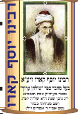
רבני וזקני קארי ונייטא פני מורי פני יחיאל עיני פני מורי פני יחיאל עיני רבני וזקני קארי ונייטא פני מורי פני יחיאל עיני פני מורי פני יחיאל עיני

מכון "הלכות פסח לשלשים יום" – ללימוד כל ארץ "הלכות פסח" שלשים יום קודם החג שעל ידי "מפעל עולמי ללימוד שולחן ערוך מחבר עם רמ"א" וזוהר ממשדור המזן בפסח – מובטח לו שלא יחטא כל השנה (האר"י"ל)