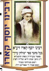
רבני וזקני ארץ יונקא על מרחיבי פני השולחן ערוך בשני עשרות שנה היו עסקי עבודת ה' ושלחן העבודת ה' (אבות י"ד)