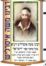
רבני וזקני ארץ יונקא על מרחיבי פני השולחן ערוך בשני עשרות שנה היו עסקי עבודת ה' ושלחן העבודת ה' (אבות י"ד)